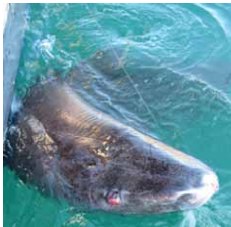
Endelig kommer den til overfladen, hvor øjet ses som den "røde klump"

Nu bliver det spændende... I det klare vand, kan vi se monsteret, der hales til vandoverfladen. Det er ikke fordi, at den gør synderligt meget modstand, men tung er den jo og sløvt vrider den sig rundt. Jimmy får kraftige handsker på og løsner fiskesnøren, så han nu holder hajen direkte i stålwiren, der bliver snoet et par gange rundt om rækværket - for en sikkerheds skyld. Mærkerne i rækværket viser tydelige spor fra tidligere fangster.