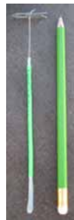
Mærket ses her i målestok med en blyant