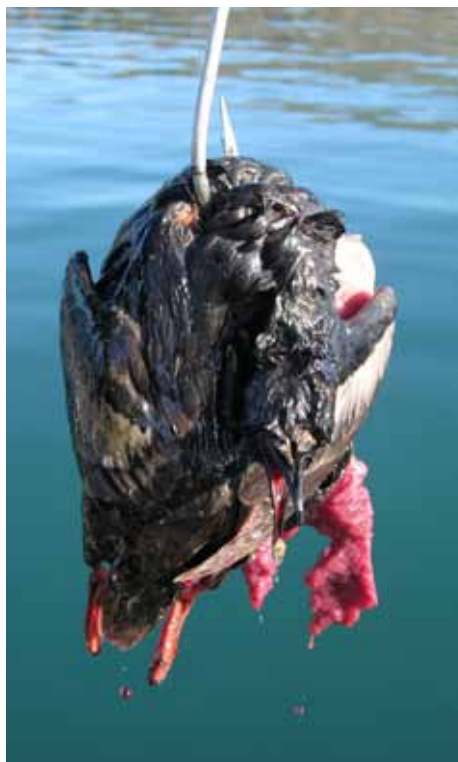
Råddent sælkød og fugleådsel på krogen

Flåden er tøjret med tov og ankerkæde til en betonblok på havbunden a'la den slags barakkerne står ovenpå. Flåden søsættes hvert år i starten af juli måned, og kommer op igen til stormsæsonen (den 15. sept.) for at undgå at blive mast i isen. Eventuelt før det, hvis der begynder at danne sig is på flåden, for så vil det være for farligt at bevæge sig rundt på den, og specielt hvis der kæmpes med en haj samtidigt.