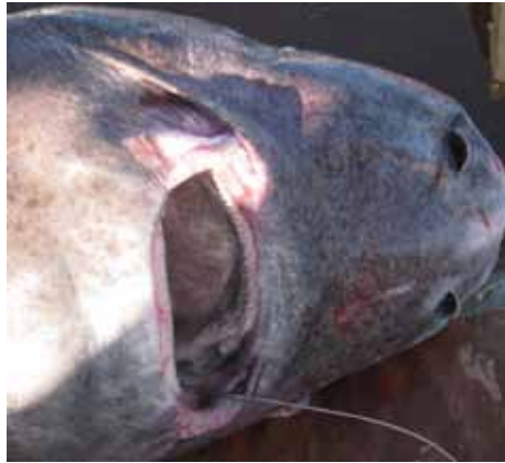
Det lugter lidt af "Dødens gab"...

Af samme grund kan man konstatere, at de må kunne blive meget gamle,