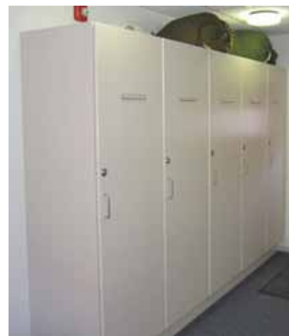
Klædeskabe til alle teknikere

jo ofte har brug for noget varmere beklædning end os "almindelige" kontorfolk. Sådanne ting lå mere eller mindre rundt omkring i bygning #113, og man var aldrig sikker på at kunne finde sin egen "bamsedragt".