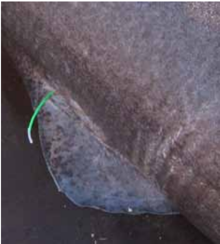
Mærket sidder lige ved rygfinnen

Alt imens er krogen pillet ud af hajens mund, og der er lige en kort stund til det obligatoriske billede af fiskeren med sit "trofæ", og en chance for os andre til igen at røre ved den og tage endnu flere billeder - men køn er den nu ikke.